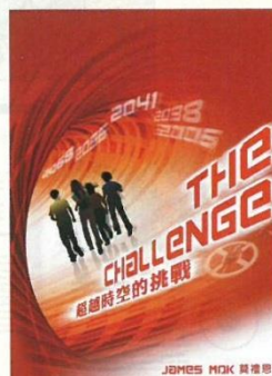
● 《超越時空的挑戰》將是中文科的課外讀物之一，日後學生可隨時經由任何平台，於任何地方閱讀。