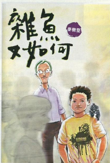
● 以成長為主題的讀書會，其中一本讀物是《雜魚又如何》。成長的主題可讓學生從其他人的經歷得到參考，活動方面曾配合郵局的免費投寄日，鼓勵學生寫作表達。