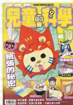
● 兒童的科學是高大的常識科課外讀物，過往難以人手一本，今個學期開始可改變此狀況。

另一項活動是故事讀寫新編，中文科最常出現問題，過往因版權及空間位置，老師給予高年級學生的文章較簡短，學生也因此經常投訴。預計配合「e悅讀學校計畫」後，就每位學生均可全書閱讀，也可隨時在校外閱讀。此外，學生的借閱記錄可成為校內獎勵的依據，學校能易於指定學科的課外讀物，並鼓勵學生完成指定數量，期望學生能自行豐富記錄。事實上，老師方面初步評估十分正面，經由教城書櫃的協助，選書的流程將加快。